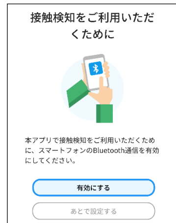
③スマホの Bluetooth を有効